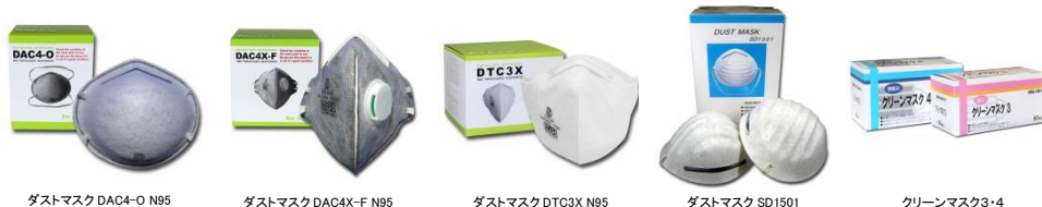
ダストマスク DAC4-O N95