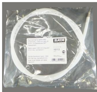
16113 ナイロンワンド 8mm X 1300mm