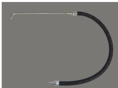
16139 フックワンド 7mm X 750mm